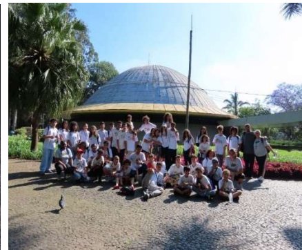
III- Sessão: Olhar o céu de São Paulo no Planetário