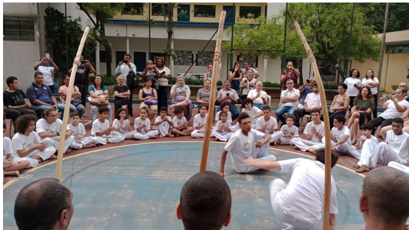
Cerimônia de encerramento anual e troca de cordões dos capoeiristas