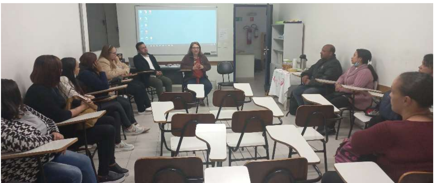
X- Reunião com familiares

Para estas turmas foi proposta a realização de Feiras de negócios, para estudo e apresentação de negócios familiares. Além de proporcionar estudo de casos práticos, teve um efeito muito positivo, tanto para trabalhar preconceitos e estereótipos, quanto para aproximar os adolescentes da realidade do trabalho dos pais, que ampliou os vínculos familiares. Os depoimentos dos familiares foram inúmeros sobre o fortalecimento de vínculos e valorização da família.