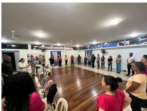
Encontro de Familiares Mar/23

Eventos e festas para integração das famílias foram realizados ao longo do ano e contou com bom envolvimento de pais, avós e irmãos dos usuários.