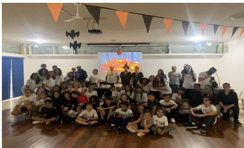
Colmeia dos Horrores