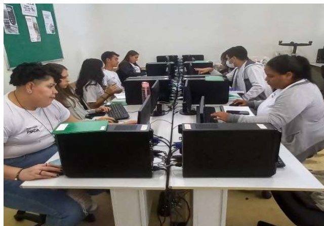
V- Atividade de integração e Informática