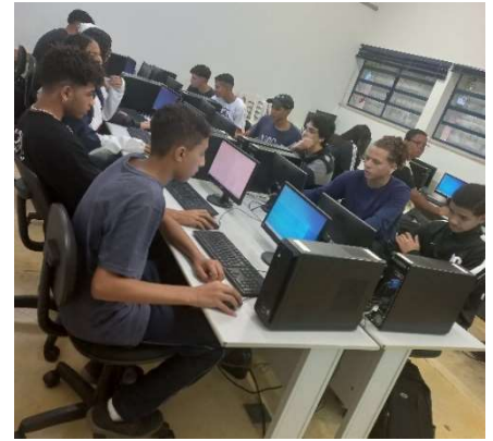
IX- Atividades práticas de Informática