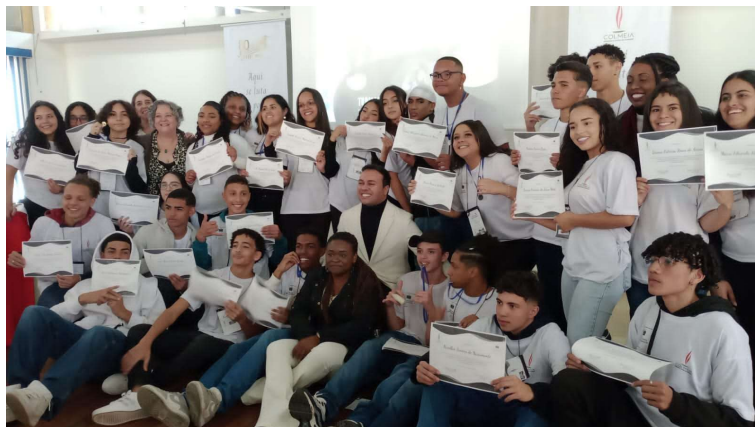
XI- Encontro de encerramentos