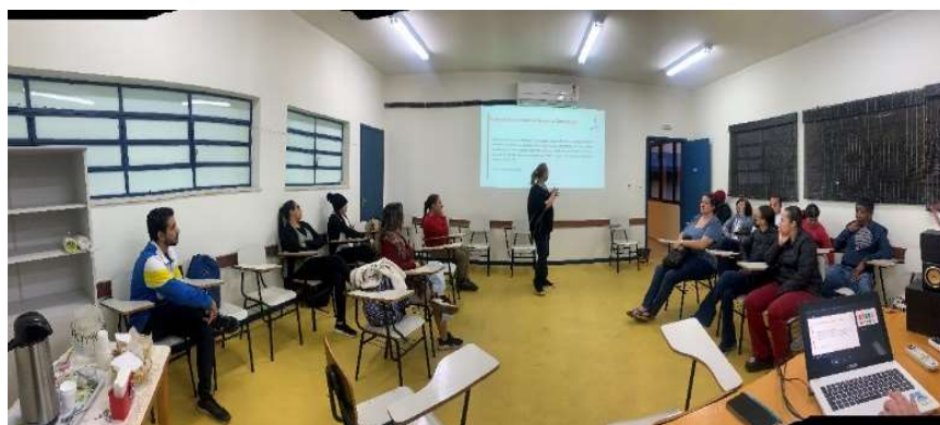
Encontro de familiares Set/23