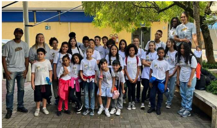
II- Espetáculo Frozen no Parque Villa-Lobos