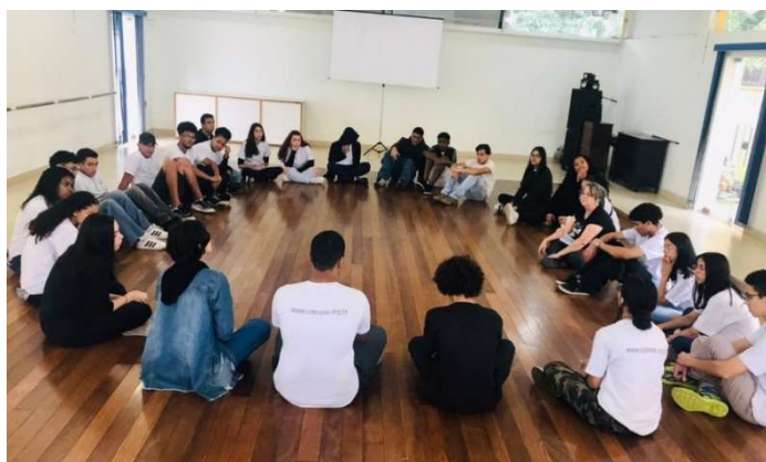
VII- Atividades de Integração