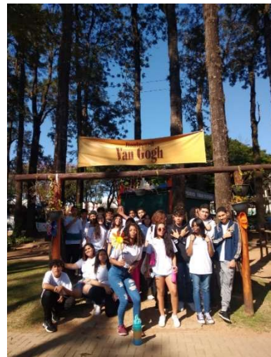
XIV- Passeio a Holambra